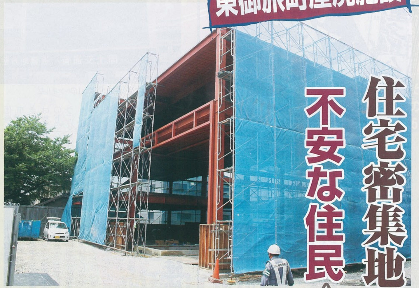
すでに工事が始まっている

「大阪府はもっと『吹田市さんが建設許可を下ろせば、府も営業許可を下ろさざるを得ませぬ』とつぶやいて、大阪府が営業許可を下ろすかどうか、こっぴどく。」 「大阪府はもっと『吹田市さんが建設許可を下ろせば、府も営業許可を下ろさざるを得ませぬ』とつぶやいて、大阪府が営業許可を下ろすかどうか、こっぴどく。」