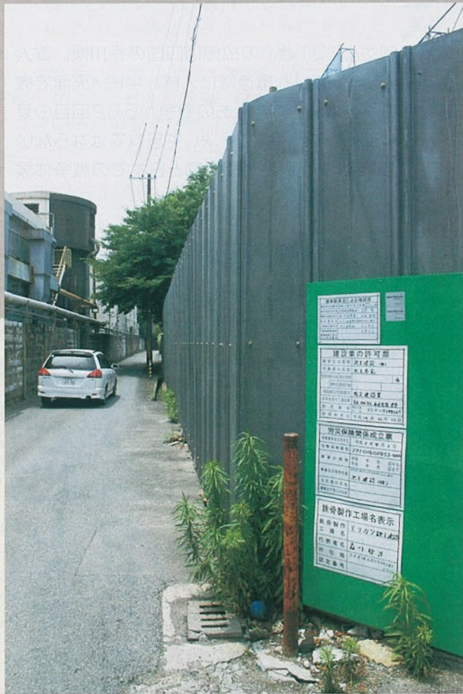
現場は高いトタン板で囲われ、内部を覗くことはできない